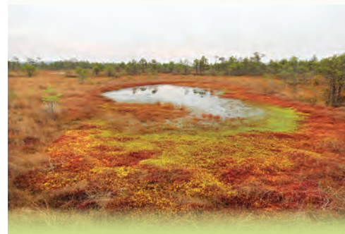
Piesātinātas krāsas rudenī