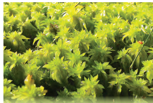
Sūnas ir izveidojušas līdz pat 8 m biezu kūdras slāni, kura virspusē tās joprojām ir dzīvas un augošas.

Augsto purvu pēdējo 8000 gadu laikā ir izveidojušas nelielas sūnas – sfagni.