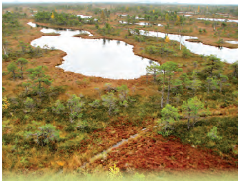
Lielais Ķemeru tīrelis ir viens no lielākajiem sūnu purviem Latvijas piekrastē – tā platība ir vairāk nekā 6000 ha.

Laipa ir būvēta no koka dēļiem, un tai ir divi loki. "Mazais" aizvedīs līdz pirmajiem gleznainajiem ezeriņiem, bet "lielais" ļaus ainavu apskatīt arī no augšas, uzkāpjot skatu tornī.