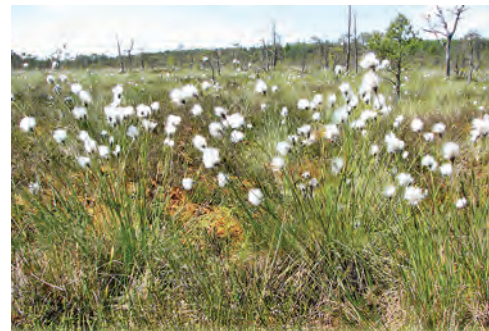
Ziedošas spilves pavasarī

ieteicams slēpošanai izmantot laipas pamatni vai arī piedalīties organizētos pasākumos ar zinošu pavadoni.