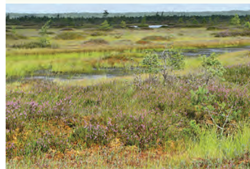
Ziedoši virši vasarā