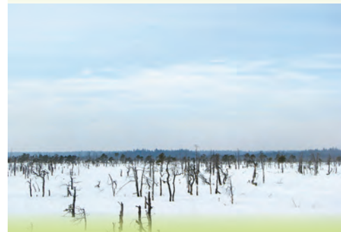
Pilnīgs miers ziemā