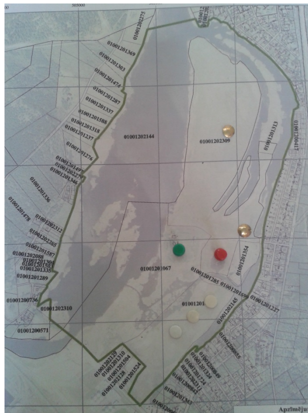
1. attēls. Klātesošie zemju īpašnieki iespēju robežās atzīmējuši savus īpašumus kartē 1

Klātesošie informē, ka daļai īpašnieku ir atjaunotas īpašuma tiesības uz nekustamo īpašumu – zemju īpašumi ir mantoti un tie ir bijuši dzimtu īpašumā jau senāk. Tomēr vairums Vecdaugavas zemju īpašniekiem zeme dabas liegumā „Vecdaugava” tika piešķirta kā kompensācija par citiem zemes gabaliem, kas tiem iepriekš piederējuši, bet uz kuriem zemes reformas laikā īpašuma tiesības nav atjaunojamas.