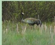
Gudenieku slapjajās pļavās ligzdo pelēkās dzērves, savukārt sausākajos mežos sastopamas vairākas dzeņu sugas.