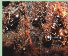
Spožās skudras Lasius fuliginosus savas ligzdas parasti veido vecu lapkoku dobumos vai pamatnē. Atšķirībā no citām skudrām spožās skudras izdalītajai skudrskābei ir saļdena smarža.