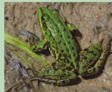
Ūdeņu tuvumā, kur zaļajām vardēm Rana esculenta netrūkst ne mitruma, ne slēptuvju, ne barības, pavasaros bieži dzirdami varžu kori.