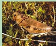
Sarkanspārņu siseņi Psophus stridulus jeb parkšķi dzīvo sausnās pļavās. Tēviņiem ir sarkana spārnu apakša, un lidojot tie rada īpatnēju, parkšķošu skaņu.