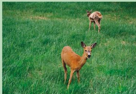
Gudenieku krūmāji un augiem bagātās pļavas stīrām Capreolus capreolus ir lieliska slēptuve un barošanās vieta vasarā. Ziemā tās pārsvarā uzturas mežos.

Aktīvais „ainavu arhitekts” bebrš Castor fiber ierīkojis sev mājvietu arī dabas lieguma centrālajā un ziemeļu daļā. Vasarā pārtiek galvenokārt no zāles un saknēm, grauzī kokus, veidojot uzpludinājumus.