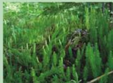
Gada staipeknī Lycopodium annotinum aizsargā gan Latvijas, gan Eiropas likumdošana.

Pašlaik botāniķi Gudeniekos konstatējuši trīs retas un īpaši aizsargājamas augu sugas. Tomēr ne vienmēr tikai aizsargājamo sugu skaits vien padara kādu teritoriju vērtīgu. Gudeniekos to nosaka lielā sugu daudzveidība.