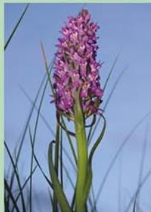
Stāvlapu dzegužpirkstītes Dactylorhiza incarnata ir sastopamas slapjās pļavās, un to klātbūtnē liecina par pļavas dabisko stāvokli.