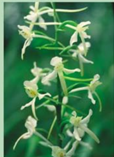
Naktsvijoles Platanthera sp. ir zināmākās Latvijas orhidejas, tomēr ne visur sastopamas, tādēļ saudzējamas.